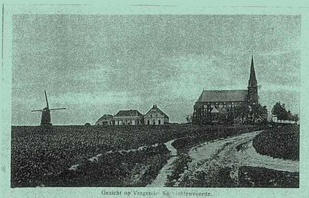
Gezicht op Vragender bij Lichtenvoorde.

PERIODIEK VAN DE VERENIGING VOOR OUDHEIDKUNDE TE LICHTENVOORDE