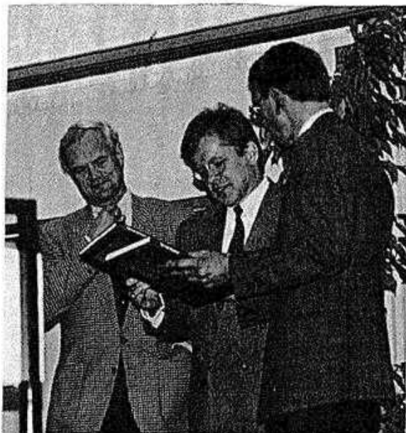
Het eerste exemplaar wordt aangeboden.

Om verder een lange rij namen te voorkomen volstond Godfried met het bedanken van iedereen die deze publikatie mogelijk heeft gemaakt of op welke wijze dan ook zijn medewerking eraan heeft verleend en besloot met de woorden: "Een stukje vervlogen, bewogen Harrevelds verleden is aan het daglicht gekomen. Ik hoop dat U er veel plezier aan zult beleven!"