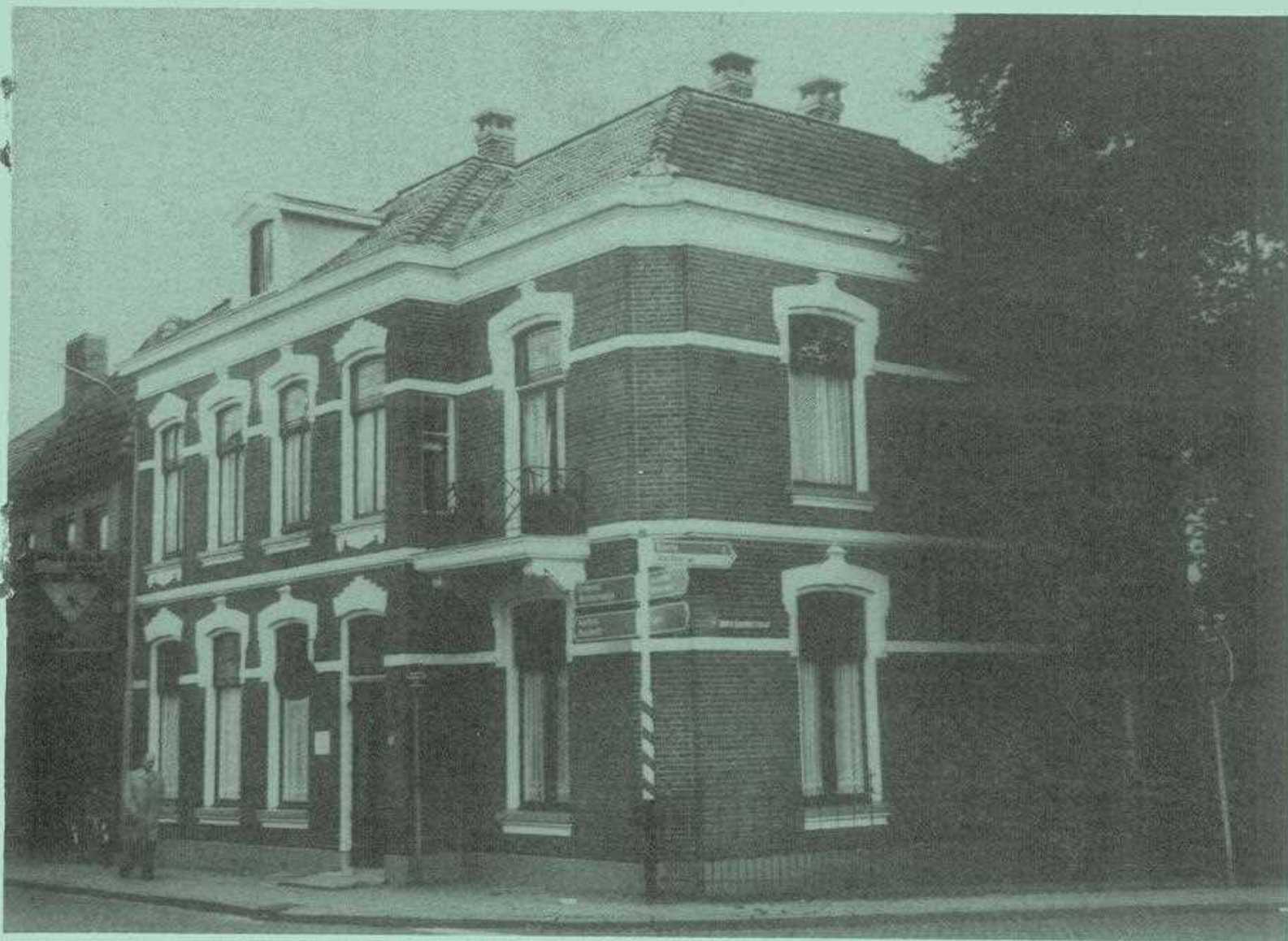
het patriciërshuis aan de rapenburgsestraat 15 te lichtenvoorde (gebouwd in 1900).

periodiek van de vereniging voor oudheidkunde te lichtenvoorde.