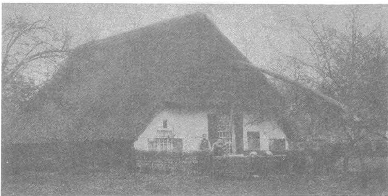
Dit oud-Saksische boerderijtje is het geboortehuis van Pater Reinders † en is later overgebracht naar het Openluchtmuseum te Arnhem.

Vanaf het begin van de negentiende eeuw begonnen de meningen over het functioneren van de marken hoe langer hoe meer uiteen te lopen. Sommigen pleitten voor verdeling der gronden onder de rechthebbenden, anderen verdedigden de oude regels.