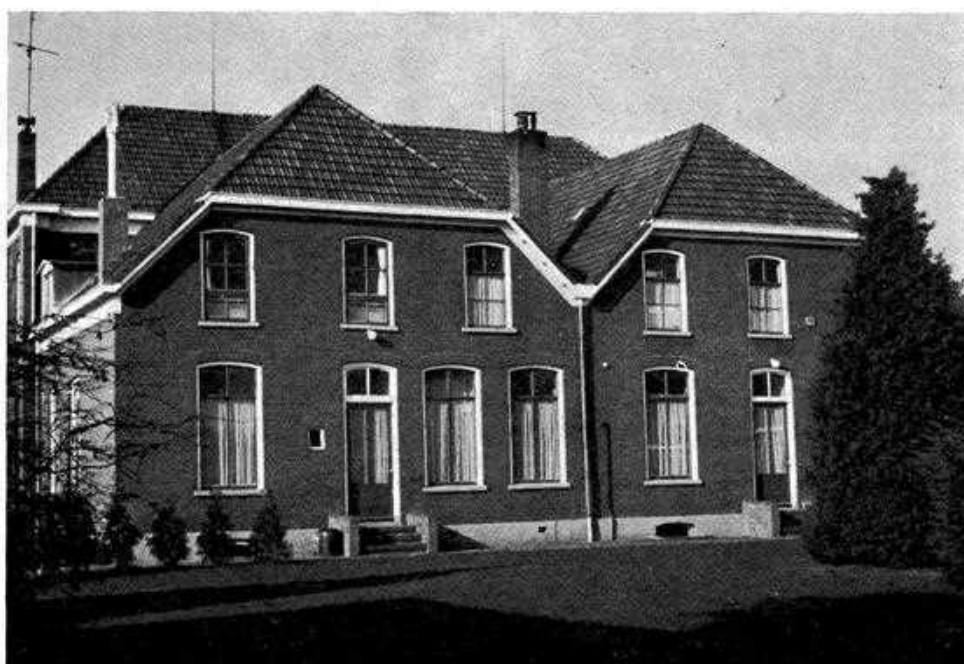
Pand Broekboomstraat 29 en 31 te Lichtenvoorde thans bewoond en eigendom van de Fraters van „St. Eloy”.