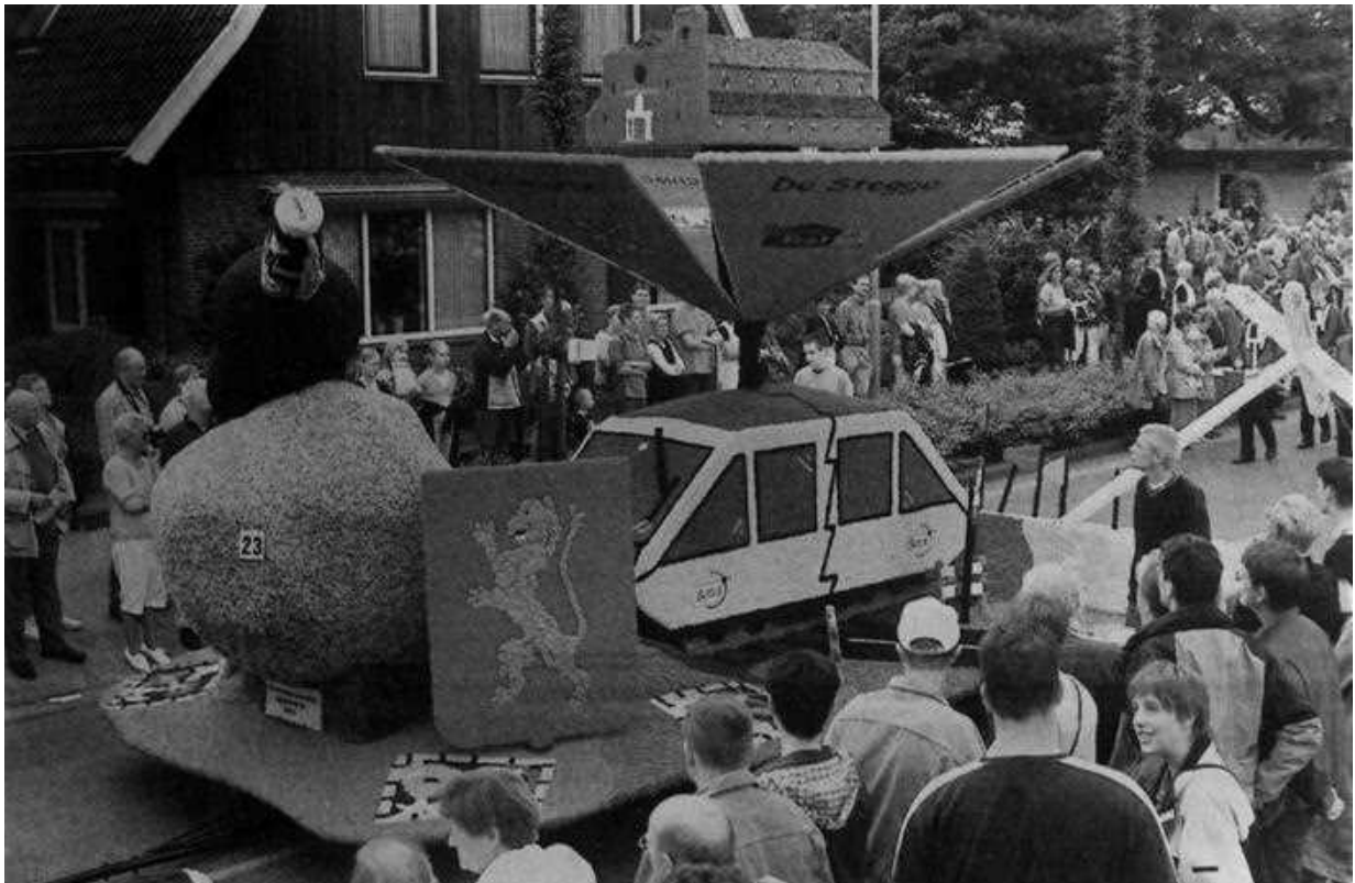
Het wolcorso anno 2001. Ook toen al stond de gemeentelijke herindeling in de belangstelling.