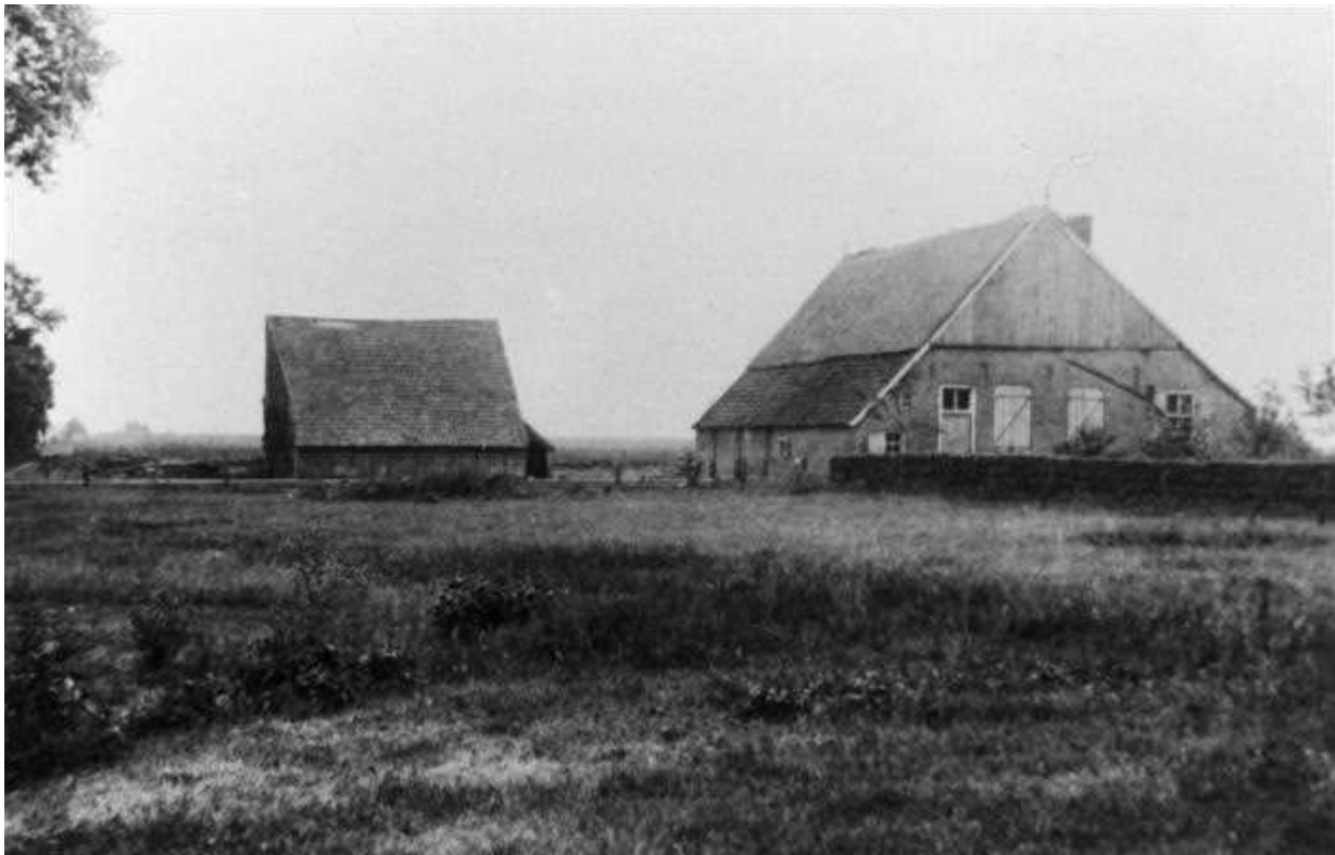
't Oude Boschkershuis uit 1797 aan de Winterwijkseweg in Vragender. Foto uit tweede helft jaren twintig van de vorige eeuw.

Een meer structurele verandering was de toename van het aantal eigengeërfde boeren in verhouding tot het aantal pachtboeren. In de zeventiende eeuw bezaten de Lichtenvoorders het merendeel van de onroerende goederen in pacht.