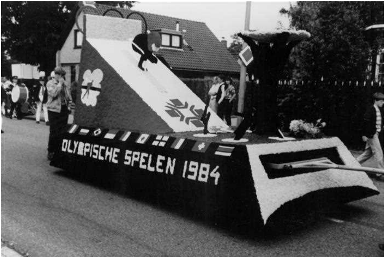
De groep HBTB, 1984, met de wagen Olympische spelen in Los Angeles.

Hoe kom je aan de goede wol en hoe krijg je het allemaal goed vast. De buitenstaander heeft daar geen idee van. Ten eerste is de de wol die gebruikt wordt een andere soort dan waar normaal mee gebreid wordt: de wol uit de karpetindustrie. Het garen uit die industrie heeft 'volume', is dus dikker dan de wol uit de brei-industrie. Wol wordt geveerd als streng en later weer gespoeld. Gespoelde garens zijn in het corso niet nodig, enkel garens op streng. De strengen worden verknipt tot stukjes van gemiddeld een cm. En met knippen wordt ook echt knippen bedoeld. Dat gebeurt met een gewone schaar. Op deze manier krijgt men dus duizenden korte stukjes wol. Je zou ze ook 'polen' mogen noemen. En omdat in het naburige Lichtenvoorde een bedrijf is gevestigd dat karpetten produceert en vaak restanten wol verkoopt, kwamen de wagenbouwers in aanraking met deze wollen garens. Het bedrijf gaf alle medewerking en de prijzen waren niet hoog.