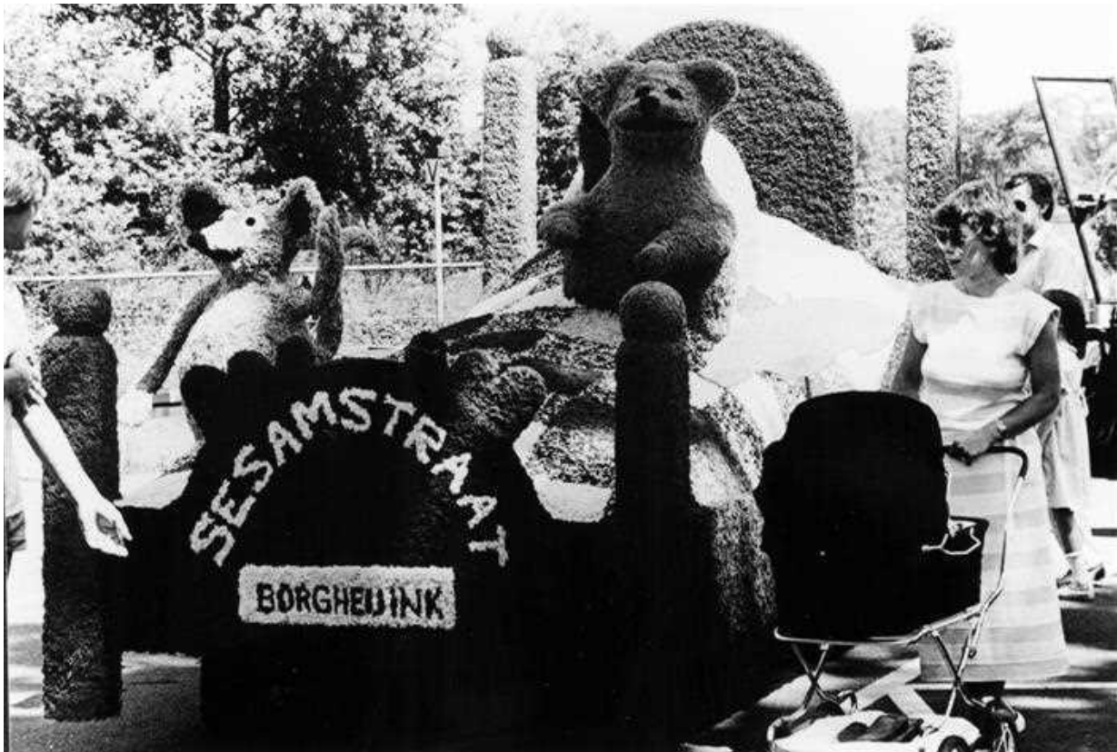
De groep Borgheijink in het wolcorso van 1985 met de wagen Sesamstraat.

Men was in Lievelede al bijna gewend aan een wolcorso, tot in het midden van de jaren tachtig de wolprijzen flink gingen stijgen. Het oude probleem was er weer: de onkosten waren hoger dan het prijzengeld. En zo bloedde het corso heel langzaam dood. Toen werden de hoofden bij elkaar gestoken en er werd naar een ander materiaal uitgezien. Houtkrullen, dát moest het gaan worden. Gewoon houtkrullen bij een timmerbedrijf ophalen, die verven in grote vaten, of eerst op de onderbouw plakken en dan in kleur spuiten. Het was nieuw; nergens ooit gezien. Toch hield deze werkwijze niet lang stand; de uitbeeldingen werden te grof en de wagenbouwers hadden de zin eraf. In het jaar 1993 was er helemaal geen optocht meer. Het bestuur van de Stichting School- en Volksfeest had dus een probleem.