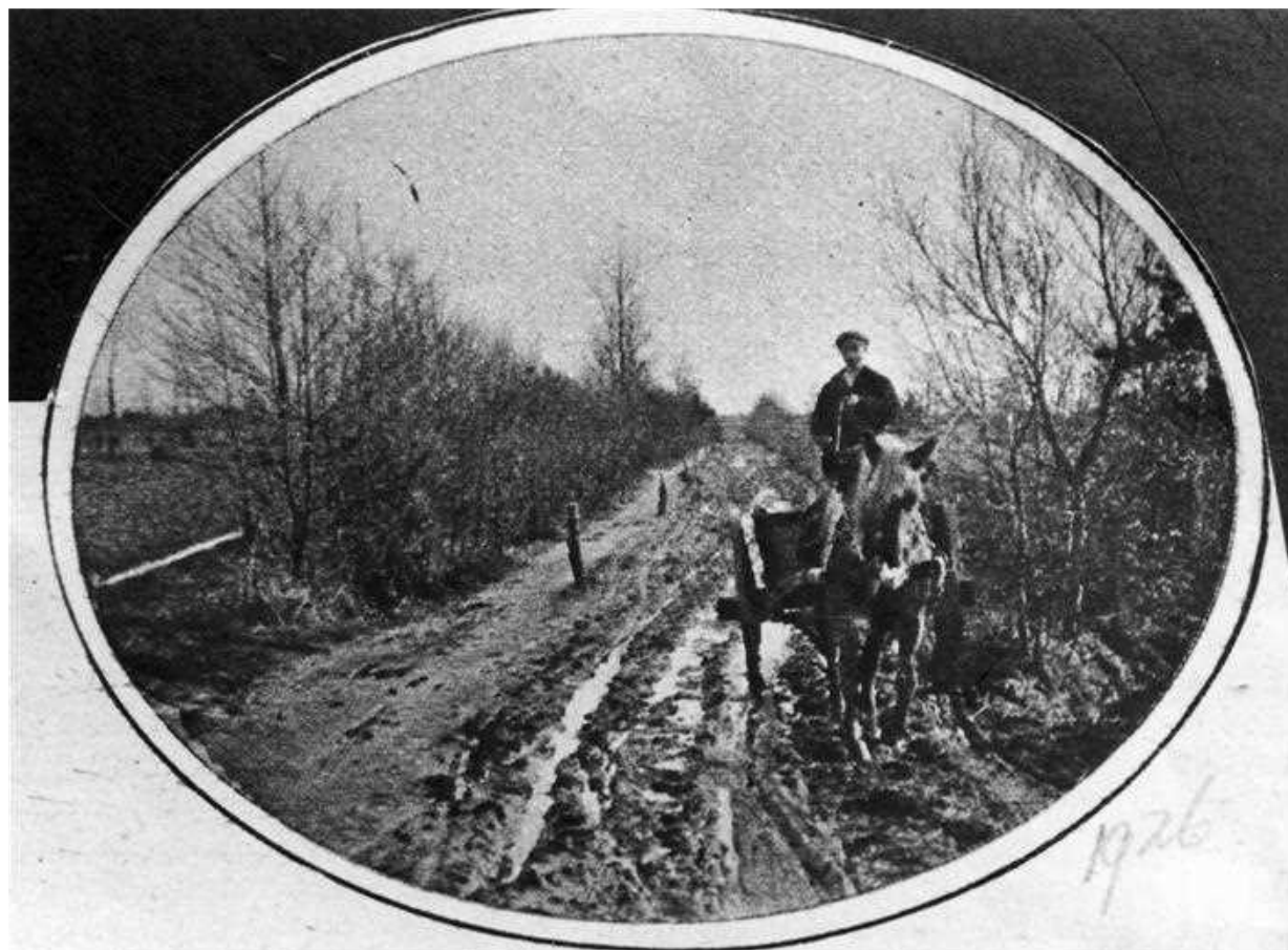
Deze foto dateert uit 1926 en is genomen in de omgeving van Lievele. Wegen als deze waren er in die tijd in de Achterhoek nog talloze. Helaas is de persoon op de foto onbekend.

Voorafgaand aan de de dia-avond was er een foto-expositie, die om 14.00 uur begon. Groot formaat school- en groepsfoto's vormden de hoofdmoot. De expositie trok ruim 140 belangstellenden. Gezellig schuifelden zij ingespannen langs de tafels en de panelen, spiedend naar vrienden en bekenden. Af en toe kon een bezoeker een kreet van verbazing niet onderdrukken, vooral als hij of zij zichzelf ontwaarde op een foto waarvan hij of zij het bestaan nooit had geweten. Voor een vriendenprijs bestelden zij een afdruk van dat kiekje bij Eppingbroek. Waar een foto-expositie al niet goed voor is.