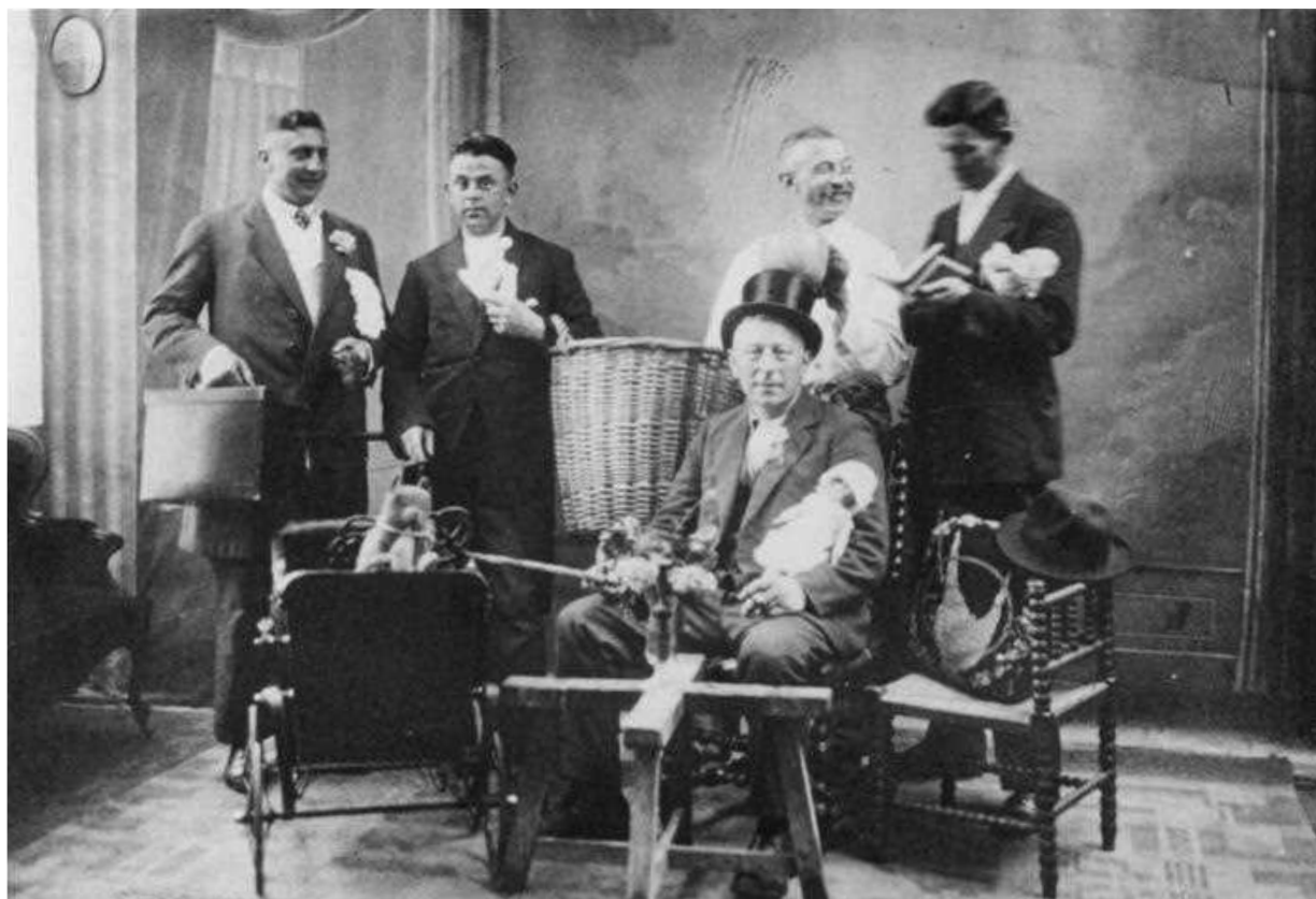
Bij Wekking werd de kermis nog een keer doorgenomen. De foto dateert uit 1934.

Op woensdagmorgen kende het kermiscomité in die tijd de zogenoemde kermisdрил, ook wel 'noabaeden' genoemd. Eerst werd het feestterrein opgeruimd, waaronder in de namiddag het grootste karwei: het wegbrengen van de vogelschacht. Deze werd elk jaar opgeborgen in de lange paardenstal van de boterfabriek. Tijdens die tocht werd bij elk danscafé even gestopt om te informeren hoe het met de kermis was gegaan en deze informatie leverde altijd een paar rondjes op. Nadien kwam men bij Willem Wekking de fotograaf bij elkaar om de kermisfoto's te bekijken.