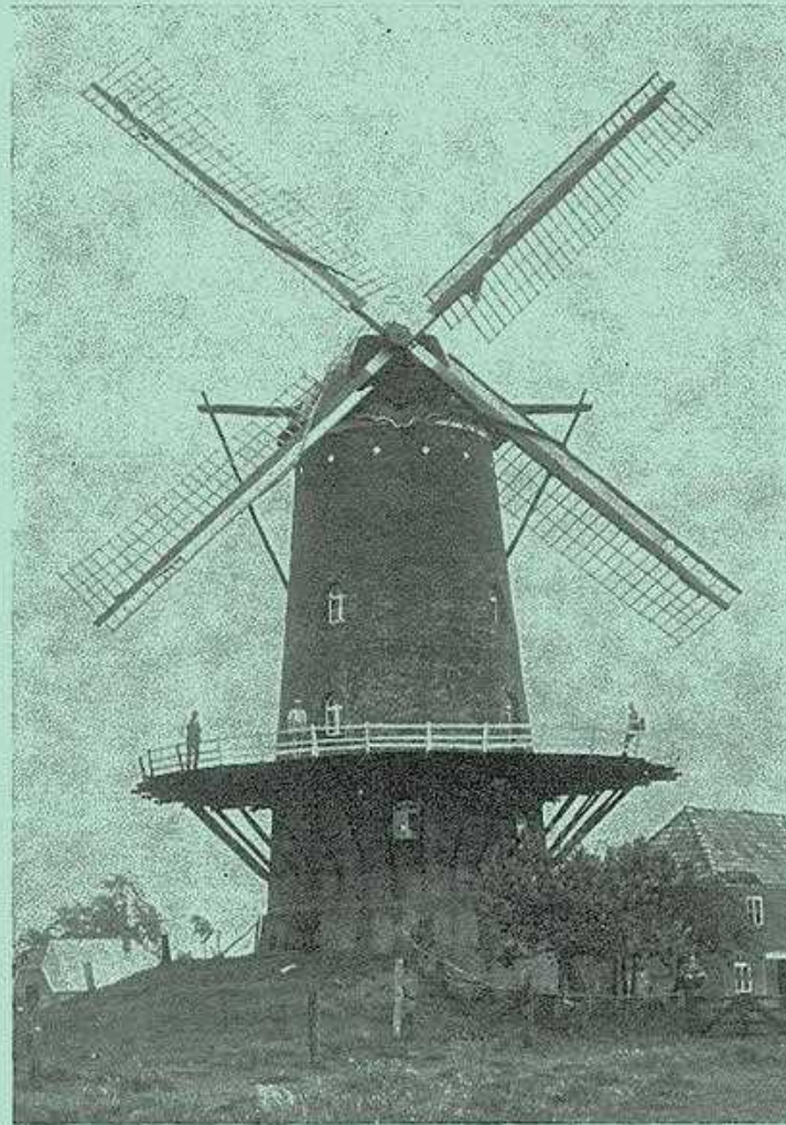
„de nieuwe molen“ gephotografeerd omstreeks 1900. zie daarvoor artikel op pag. 1.

periodiek van de vereniging voor oudheidkunde te lichtenvoorde.