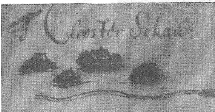
HET KLOOSTER SCHAER BIJ BREDEVOORT (Vervolg 1) door G.A.W. Boerkool, Aalten.