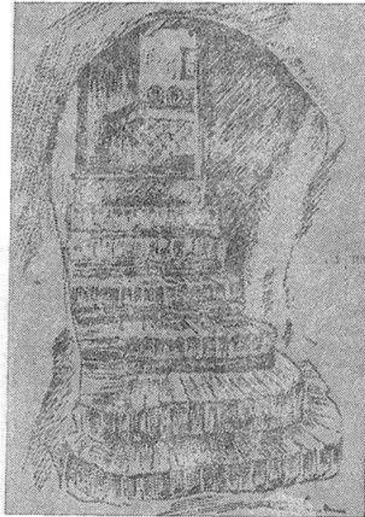
Op de foto een tekening van Piet te Lintum van de oude keldertrap van het klooster 't Schaer die nog enige jaren geleden aanwezig was in de huidige boerderij 't Schaer in Vragender.