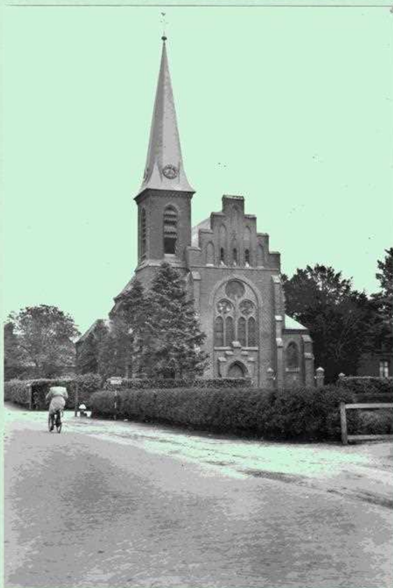
DE VOORMALIGE KERK VAN DE ST. ANTONIUS VAN PADUA-PAROCHE TE VRAGENDEP, DIE HET VOLGENDE JAAR 100 JAAR BESTAAT. OVER DE OPRICHTING VAN DEZE PAROCHE ZIE PAG. 15 E.V.

PERIODIEK VAN DE VERENIGING VOOR OUDHEIDKUNDE TE LICHTENVOORDE