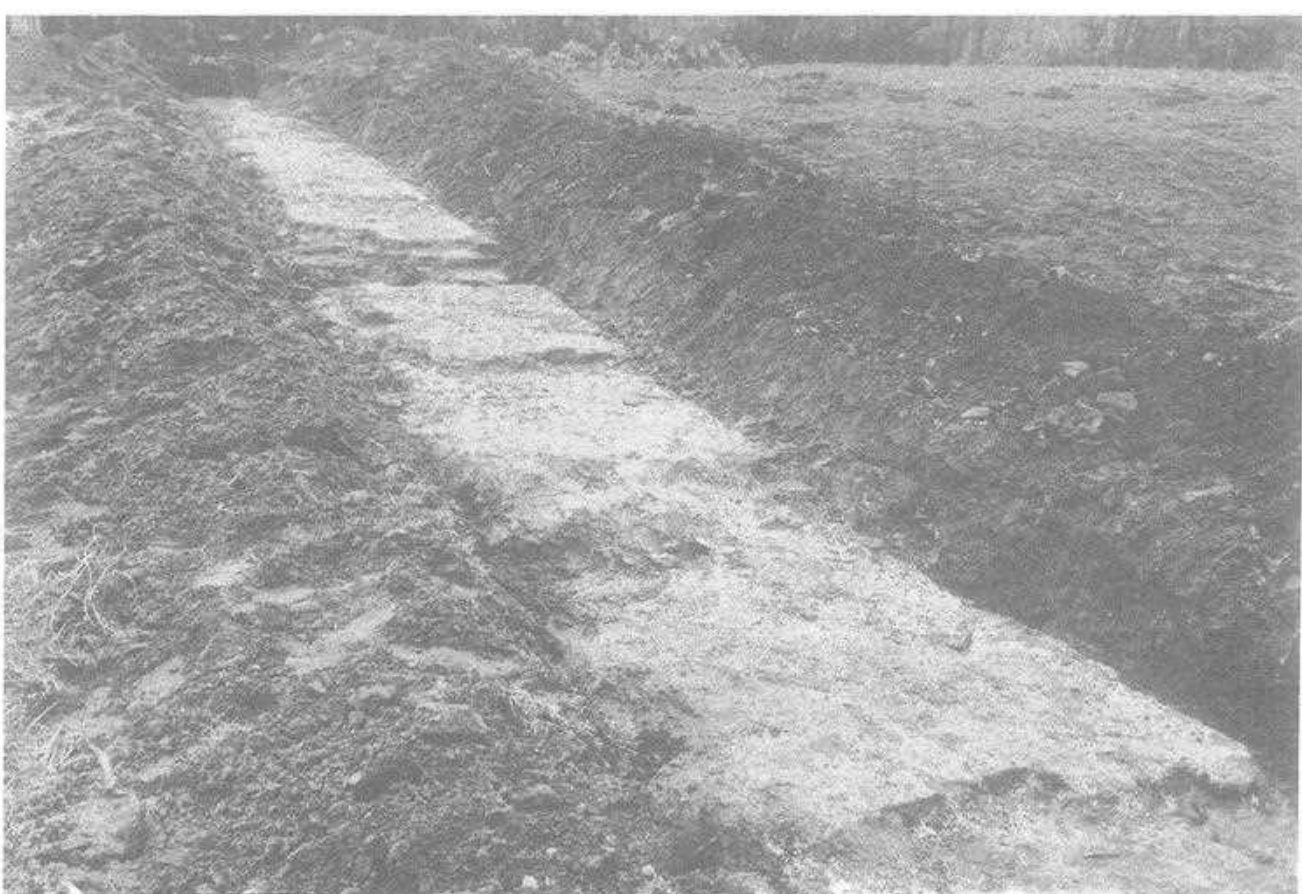
Hier ziet men het 35 meter lange fundament, dat wel 65 cm breed is en nu nog 40 centimeter onder het maaiveld ligt.