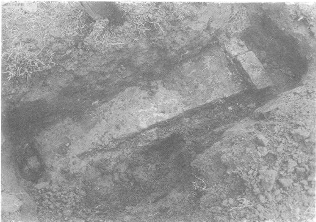
Op dit fundament is wel zeker de voorgevel van kasteel Lichtenvoorde gebouwd en vormt de hoeksteen. Het huidige "'t Hof" was toen al de oprijlaan van het toenmalige kasteel.