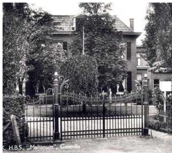
1948. Groenlo. Lichtenvoordseweg. Villa Wolters

De locatie was dus geregeld. Nu de toekomstige leerlingen nog. De hoofden van scholen in Groenlo en verre omgeving werden benaderd en die zorgden voor kandidaten. Voordat die echter toegelaten konden worden tot de