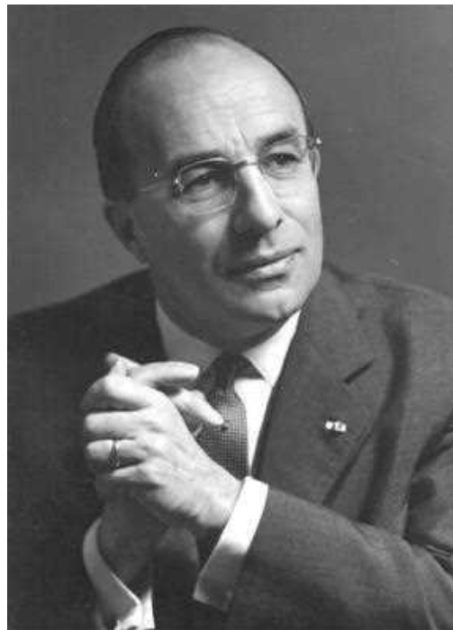
1966. Minister Mr. J. L. M. Cals

Voor minister Cals was de zaak allang besloten. Hij had er geen behoefte aan om alles nogmaals op te rakelen. In een brief liet hij op 15 oktober 1957 Herman Hulshof dan ook weten: “De plaats van vestiging van een bijzondere school is een aangelegenheid van het