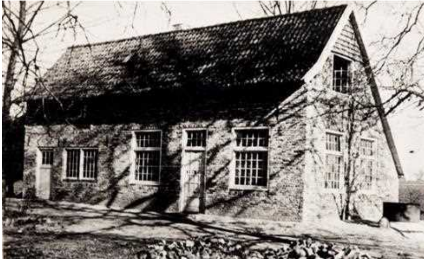
1950. Erve Kots, Eimersweg 4, Lievelede. Noodonderkomen studenten

De lessen theologie werden vooruitlopend op de bouw al gegeven op Erve Kots, waar een zestal studenten met broeder Jozef in het najaar van 1950 ingekwartierd was.