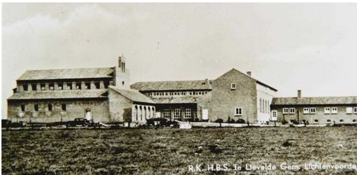
Een ansichtkaart uit 1951. Van het in aanbouw zijnde Loreto moet de vleugel met hoofdingang nog gebouwd worden. Wat opvalt is dat Loreto wordt aangeduid als "R.K. H.B.S. te Lievelede Gem. Lichtenvoorde".

In het najaar van 1951 kon het "intrek-kersmäöltjen" gehouden worden, hoewel het metselwerk nog niet droog was.