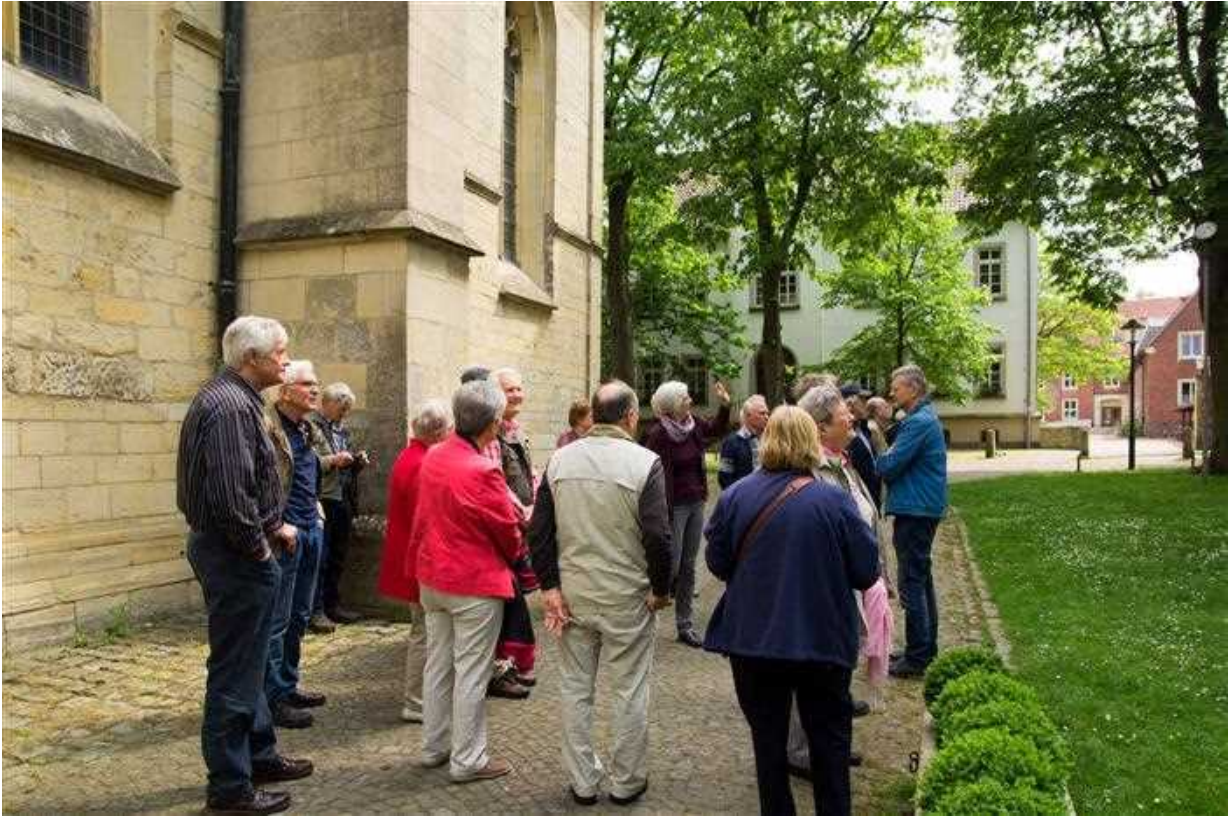
Rondgang door de stad onder leiding van een stadsgids