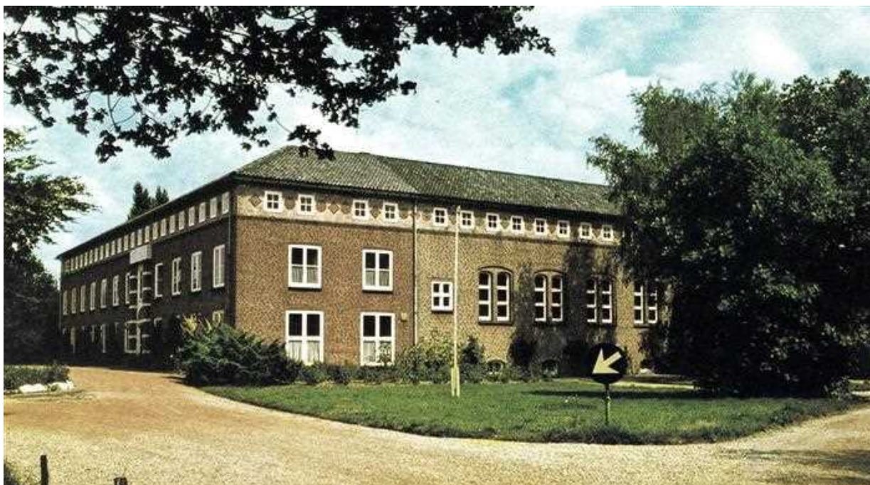
1980 Lievelede Kloosterstraat. Huize Loreto

Aan de Kloosterstraat in Lievelede, tussen de Lieveledebeek, de spoorweg en de Twenteroute ligt, vredig tussen enig groen, een door paters Maristen opgericht monumentaal gebouw, 'Huize Loreto', in de Lieveledse volksmond 'het klooster'.