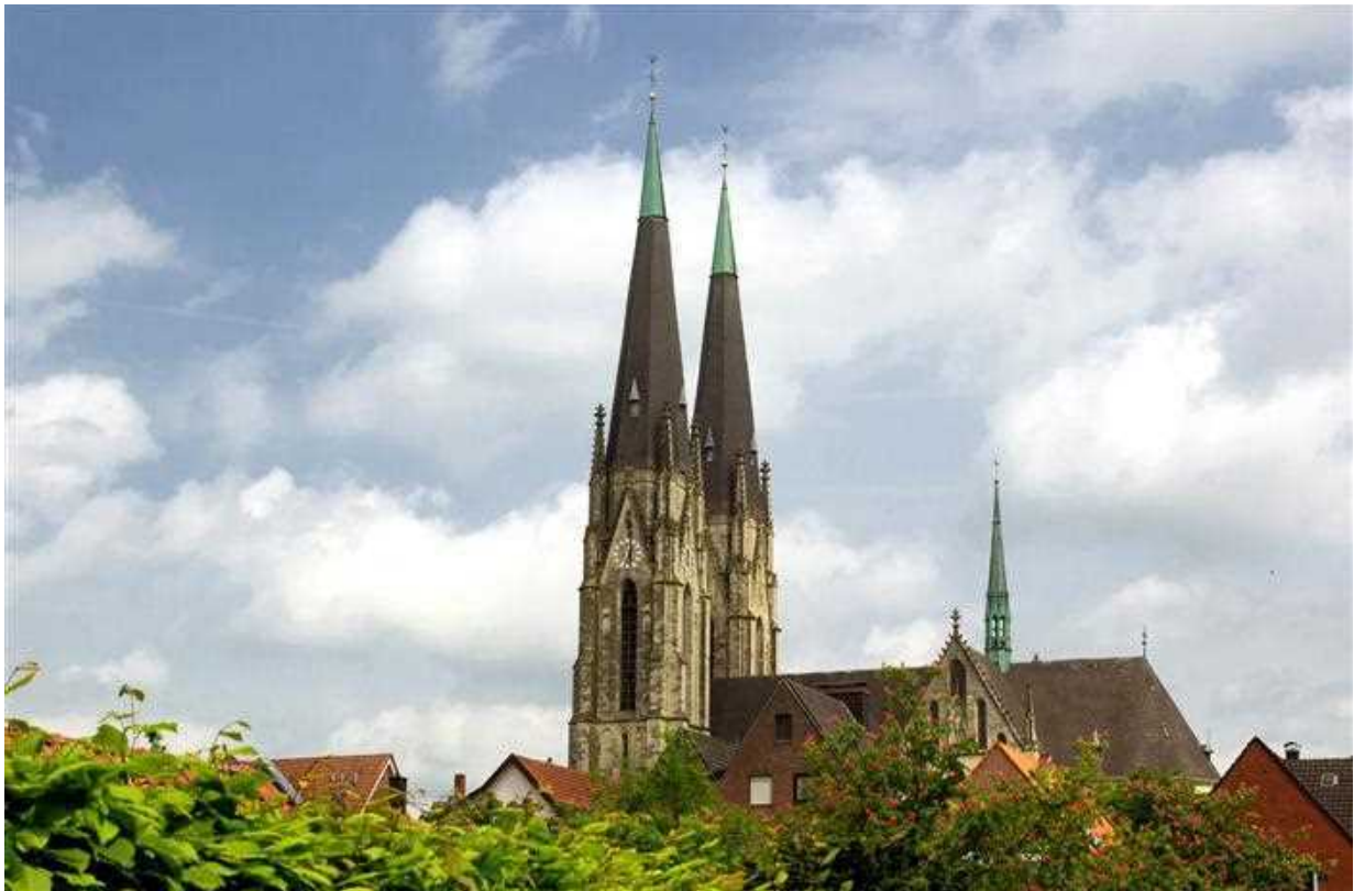
Komend vanuit de 'Baumberge' zie je in de verte al de torens van de Ludgerusdom.