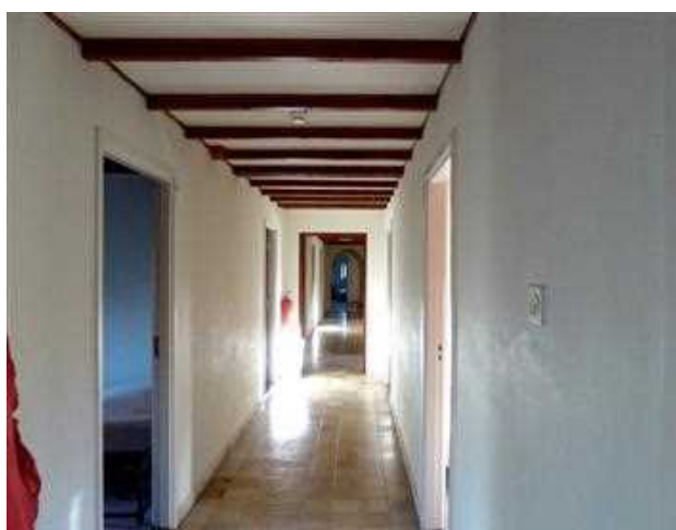
2016. Loreto. Gang studentenkamers