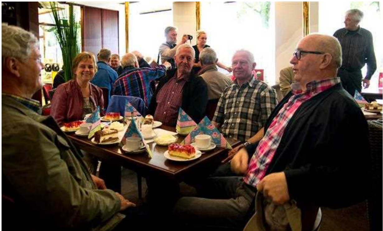
Welkom in Billerbeck met koffie en gebak.