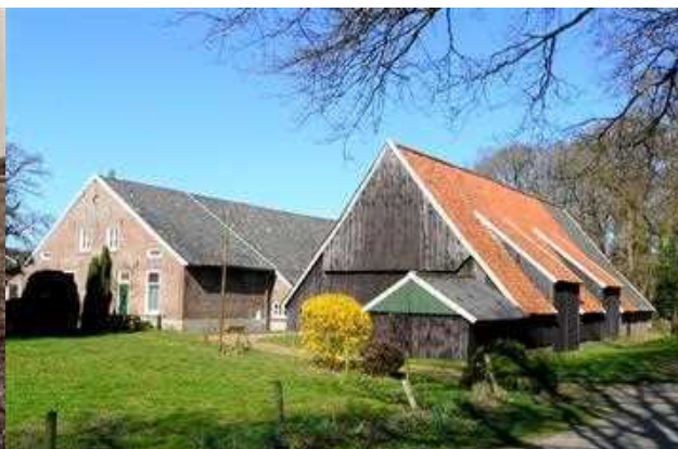
Erve Braker 2010