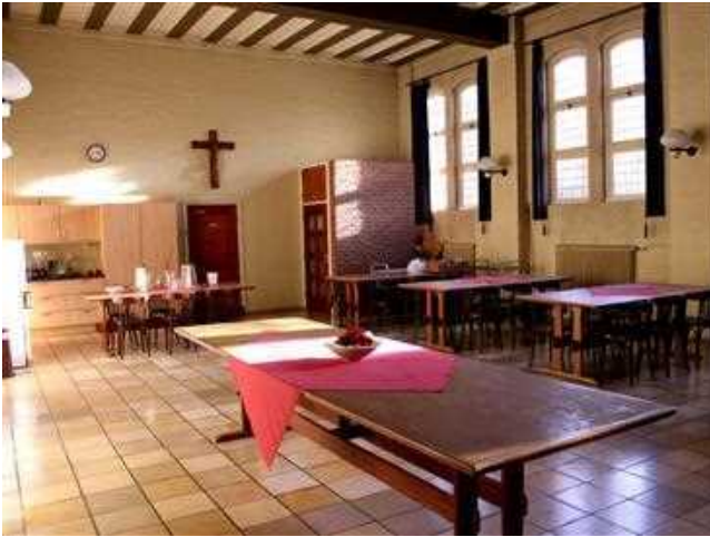
2016 Loreto. Eetzaal