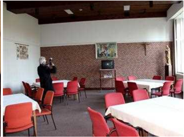
2016 Loreto. Gehoorzaal

Westerhelling in Nijmegen, waar ze colleges gingen volgen aan de Katholieke Universiteit. Wel bleef er nog steeds een gemeenschap van Maristen op Loreto. In Loreto werd een opleiding voor leerling-bejaardenverzorgsters gehuisvest. Over een periode van een tiental jaren haalden enkele honderden hier hun diploma.