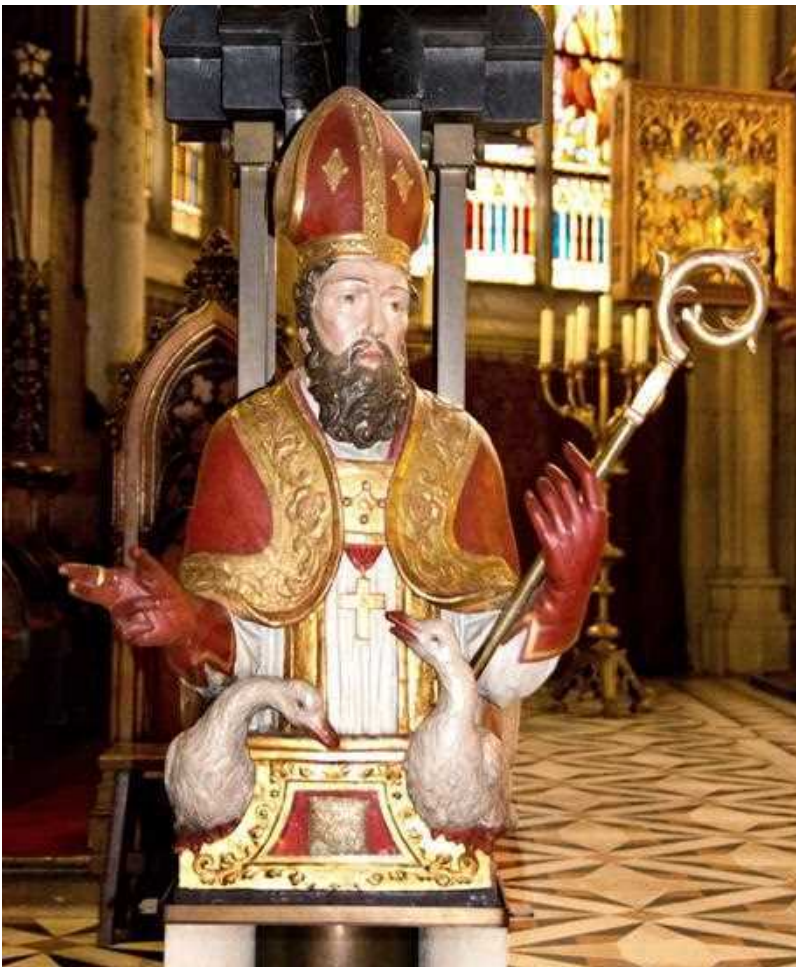
In de dom het bustebeeld van St. Ludger uit 1735. Naast zijn bisschoppelijk gewaad met staf en mijter is hij herkenbaar door de twee ganzen aan zijn voeten. Volgens de legende heeft hij eens de wilde ganzen van een akker verdreven.