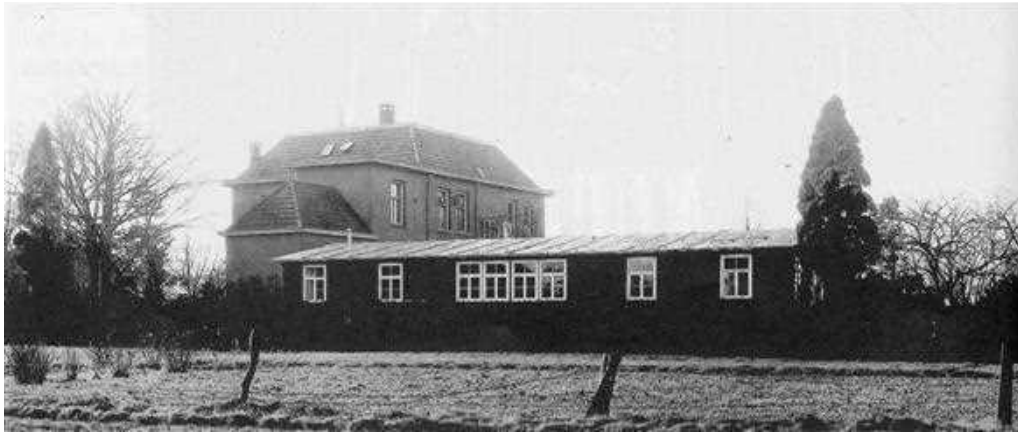
Groenlo januari 1949. Eerste lesbarak van HBS Marianum in gebruik genomen