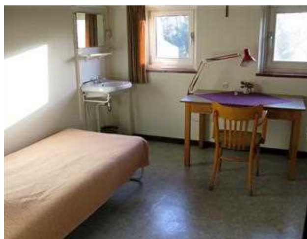
2016 Loreto. Studentenkamer