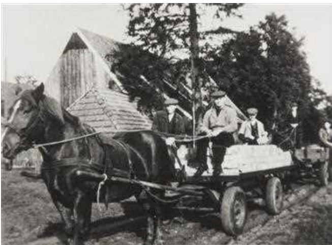
1950 Lievelede. Bouw klooster Loreto. Aanvoer stenen per paard en wagen.

Tot de medewerkers behoorden ook de studenten die een onderkomen op Erve Kots hadden gevonden. Terwijl ze daar in de voormiddag met hun hersens trachtten door te dringen in de geheimen van de theologie, trokken ze 's middags, gewapend met spa en schop, naar het dennenbos aan de Aaltensedijk om naar metselzand te graven.